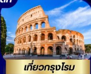
เที่ยวกรุงโรม