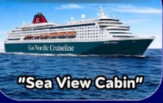
"Sea View Cabin"