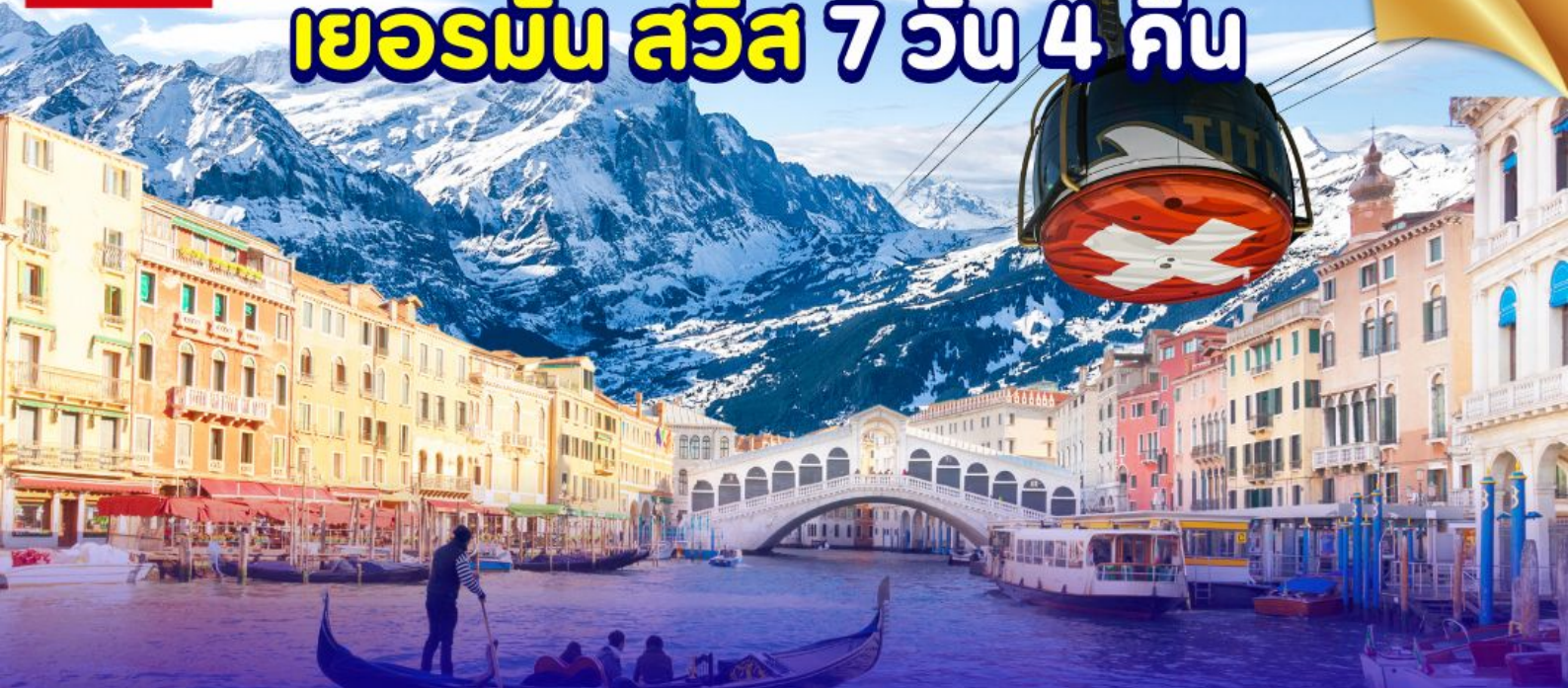
ยอดเขากิตลิส