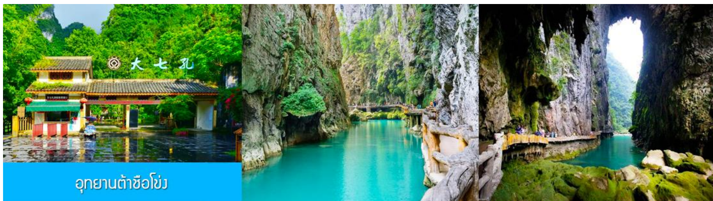
อุทยานต้าซือโข่ง

เช้า รับประทานอาหารเช้า ณ ห้องอาหารของโรงแรม (10)