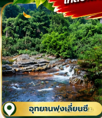
อุทยานฟงเลี่ยนชี่