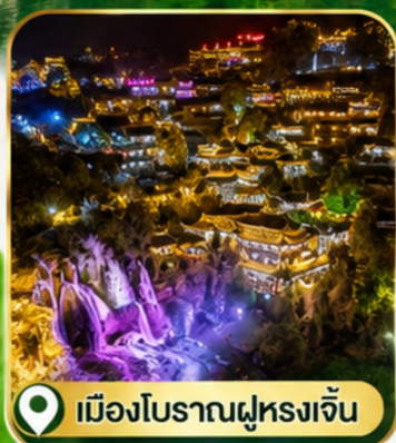
เมืองโบราณฝูหลงเจิน