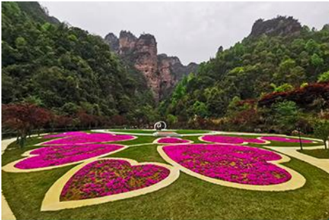
อุทยานฟงเลี่ยนซี