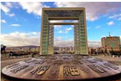
ประตูแห่งโชคกลาง