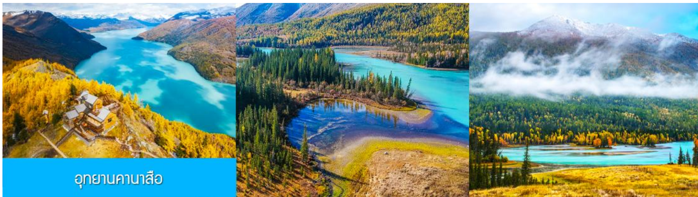
อุทยานคานาสีอู