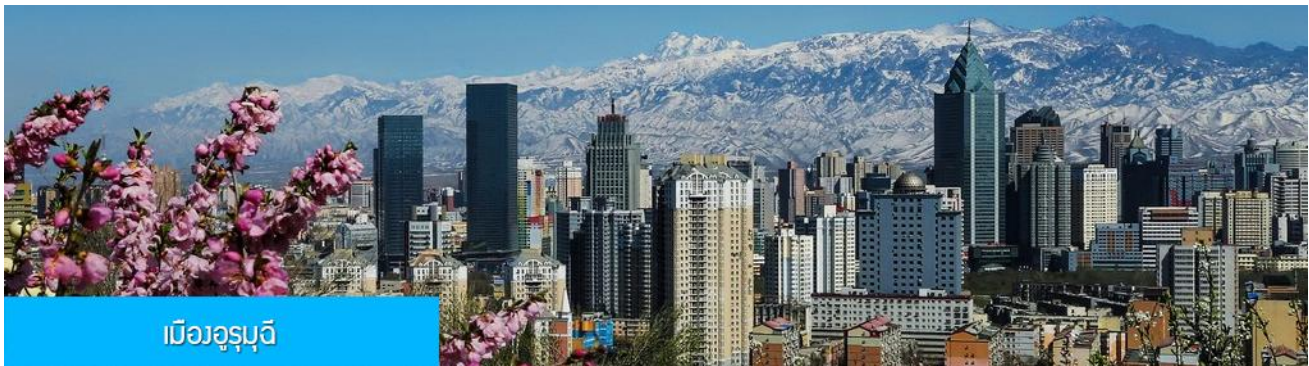
เมืองอูรูมูจี

พักที่ MERCURE HOTEL โรงแรมระดับ 4 ดาวท้องถิ่นหรือเทียบเท่าในเมืองวูรูมูจี