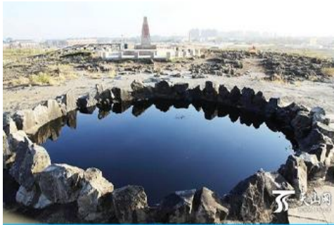
บ่อน้ำมันสีดำ