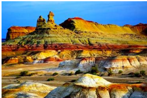
เมืองผีวูเอ๋อเหอ

พักที่ XI BU WU ZHEN HOTEL ระดับ 4 ดาวท้องถิ่นหรือเทียบเท่าในเมืองวูเอ๋อเหอ