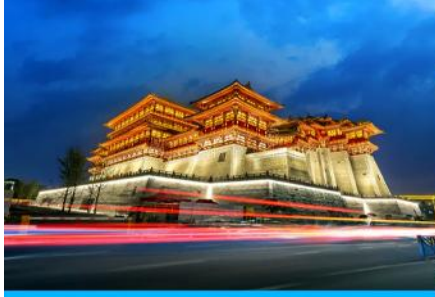
นครลั่วหยาง