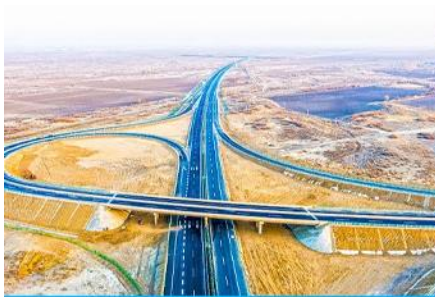
S21 DESERT HIGHWAY