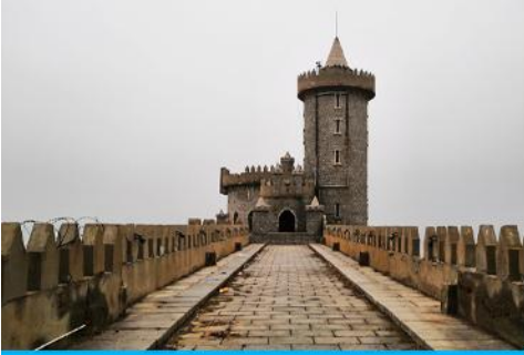
คาเฟ่อีสต