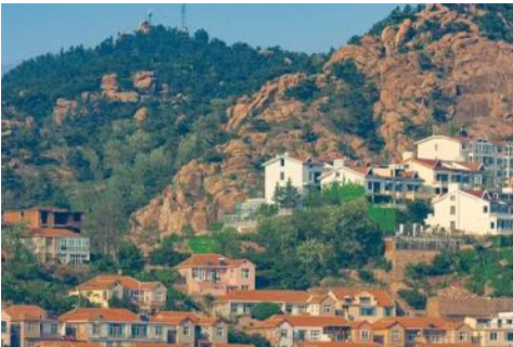
หมู่บ้านชาจื่อโข่ว

จากนั้นนำท่าน เดินทางสู่ คาเฟ่อีสต 落日古堡 นำท่านชมปราสาทในเทพนิยาย ที่ตั้งตระหง่านอยู่ริมชายหาด นานาชาติเวทย์ให้ คาเฟ่ที่ออกแบบด้วยสถาปัตยกรรมสไตล์ยุโรป ตัดกับวิวทะเลสีคราม และที่นี่คือแม่เหล็กดึงดูดนักท่องเที่ยวมาเก็บบรรยากาศความสวยงามความ โรแมนติก ( ตัวปราสาทเป็นร้านกาแฟ หากท่านต้องการเข้าไป ด้านใน ต้องจ่ายค่าเครื่องดื่ม ตามเมนูของทางร้าน ซึ่งไม่รวมในอัตราค่าทัวร์ )