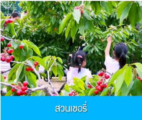
สวนเชอร์รี่

รับประทานอาหารเช้า ณ ห้องอาหารของโรงแรม (10)