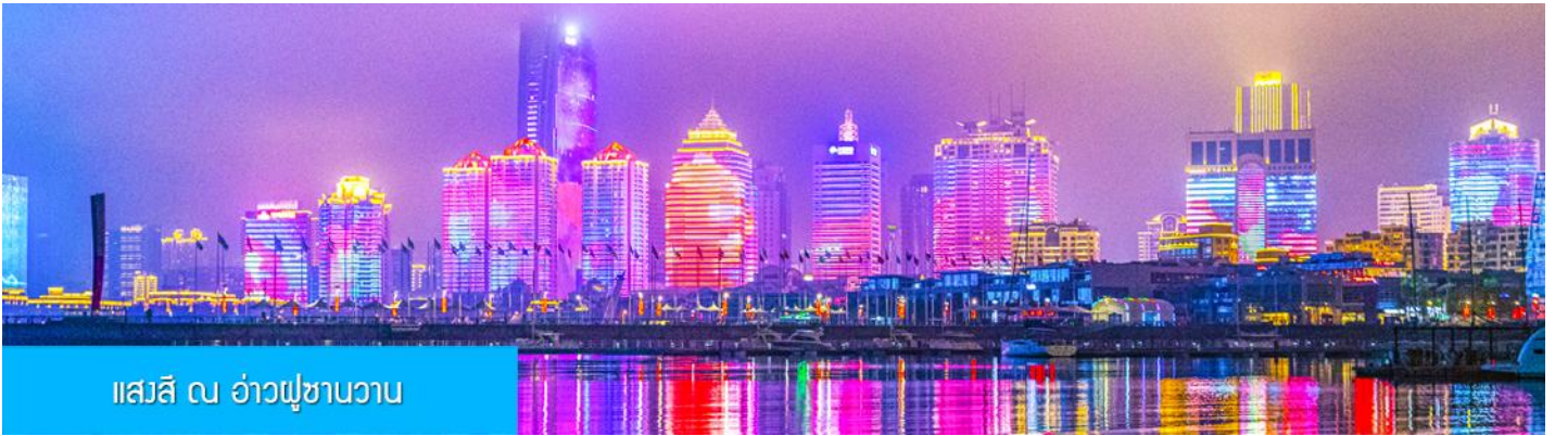
แสงสี ณ อ่าวฝูซานวาน