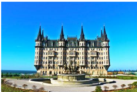
อุทยานหวินเจิง

หลังอาหารนำท่านไปเยือนเมืองท่าสุดโรแมนติกสไตล์ยุโรป ท่าเรือชาวประมง ให้ท่านได้ชมสถาปัตยกรรม สไตล์อเมริกันเหนือ และ ยุโรป ที่ตั้งอยู่ในพื้นแผ่นดินจีน ณ เมืองเยียนไถ เก็บบรรยากาศลมทะเล และเก็บรูปกับ อาคารหลังคาสี่เสาสีเป็นฉากหลัง ที่เต็มไปด้วยมนต์เสน่ห์และความทรงจำที่สวยงาม ให้ท่านเก็บภาพความสุข