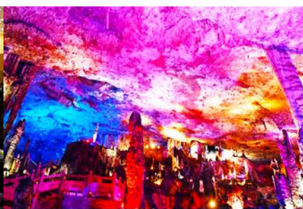
ถ้ำเก้าสวรรค์ควี้วเทียนตัง