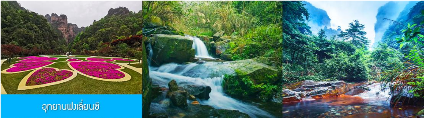
อุทยานฟงเลี่ยนซี