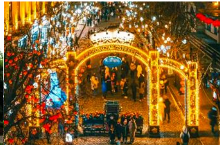
ถนนวงเวียนต้าเจีย