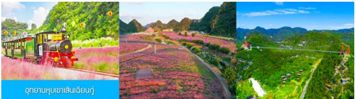
อุทยานหุบเขาเสินเฉียนกู่