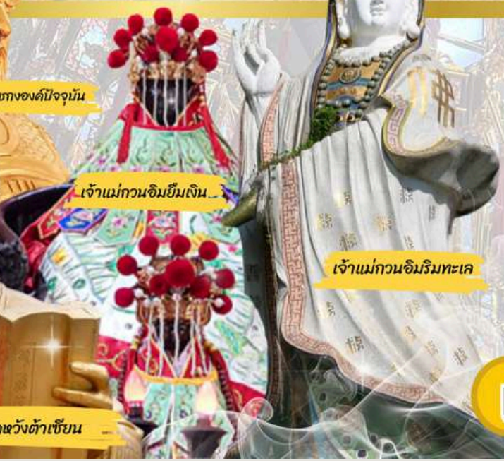
เจ้าแม่กวนอิมยืมเงิน