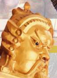
วัดแห่งองค์ปัจจุบัน