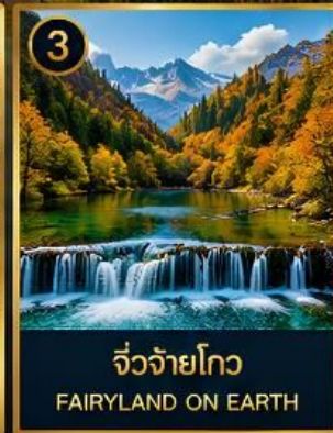
3 จี๊วจ้ายโกว FAIRYLAND ON EARTH