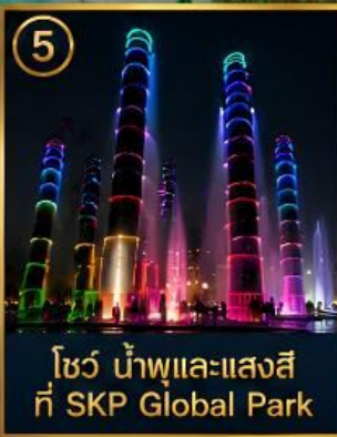
5 โซว น้ำพุและแสงสี ที่ SKP Global Park