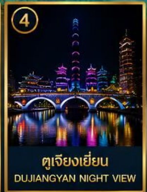
4 ตูเจียงเยียน DUJIANGYAN NIGHT VIEW