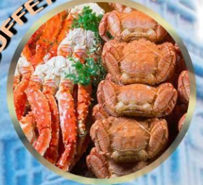
SAPPORO SNOW FESTIVAL 2027