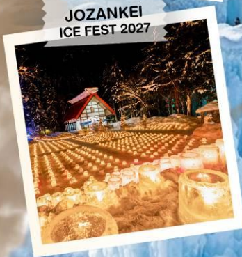
JOZANKEI ICE FEST 2027