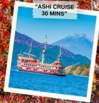
"ASHI CRUISE 30 MINS"