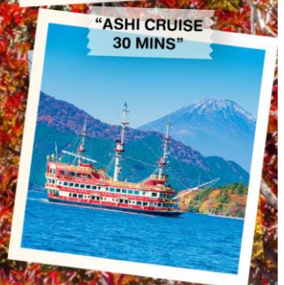
"ASHI CRUISE 30 MINS"