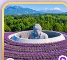
เนินพระพุทธรูปเจ้า