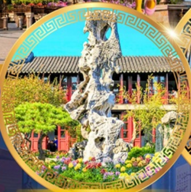
สวนหลิวหยวน

ถนนหนทางจิ้งจู้ หาดไว่ทาน ชมหอไข่มุก ล่องเรือทะเลสาบซีหู ตำนานพญางูขาว เจดีย์เหลยเฟิง ถนนเลี้ยวเหอจื่อเจีย วัดหลงหยวน สวนหลิวหยวน ซุปป์ิง ถนนกวนเจียนเจีย ถนนซีหลี่ซานถึง วัดพระหยก เซคอินย่านเก่าซิ่นเทียนตี้ สักการะศาลเจ้าพ่อหลี่ก๊กเมือง