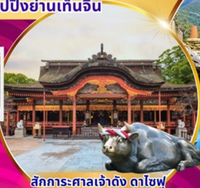
สักการะศาลเจ้าดัง ดาไซฟู