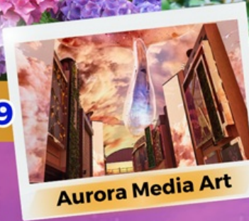
Aurora Media Art