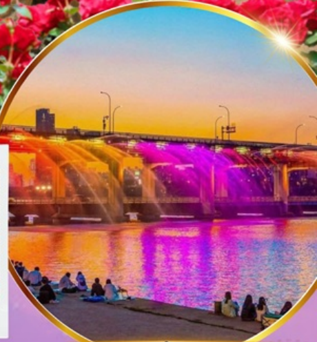
ชมสะพานน้ำพุสายรุ้ง