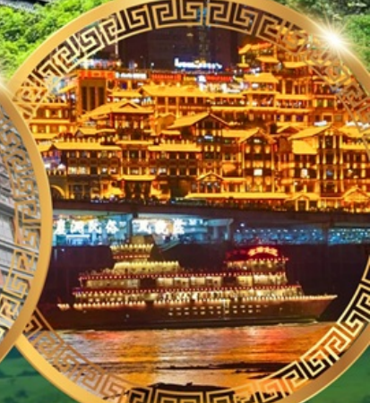
ล่องเรือแม่น้ำแยงซีเกียง

อุทยานแห่งชาติหลุมฟ้าสะพานสวรรค์ ระเบียงกระจก อุทยานเขานางฟ้า ใต้เจียเซียง ห้างการ์เด็นควางหวน พระพุทธรูปแกะสลักหิน หมู่บ้านโบราณฉือชี่ไช่ ชมรถไฟฟ้าทะลุตึก ตึกหุยชิ่ง ตึกตะเกียบ ถนนคนเดินเจียฟางเป่ย์ ล่องเรือแม่น้ำแยงซีเกียงวิวคำคิน อิสระช้อปปิ้งหงหยาดัง