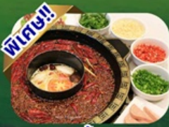
เมนูสุกี้หม่าล่า

พักโรงแรม 4 ดาว ★★★★★ ฟรี ประกันอุบัติเหตุ บริการอาหารท้องถิ่น