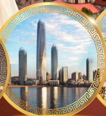
ชมวิวดาคารไฮตัน เซ็นเตอร์