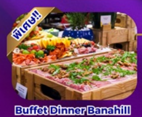
Buffet Dinner Banahill