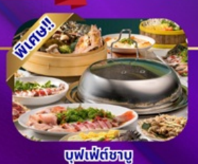
ซูฟฟีตชาบู