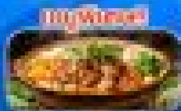
สุกี้ไก่