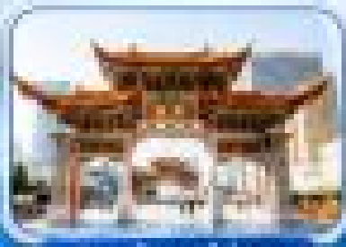
เมืองฉางชุนโบราณ