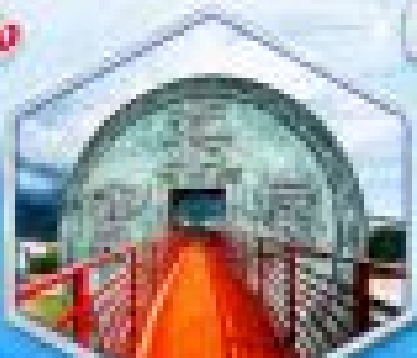
สวนพฤกษศาสตร์