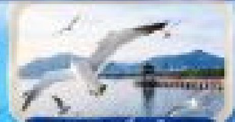
ทะเลสาบอู๋ยแจ๋อ