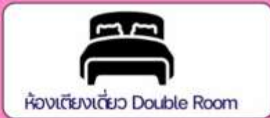
ห้องเตียงเดี่ยว Double Room