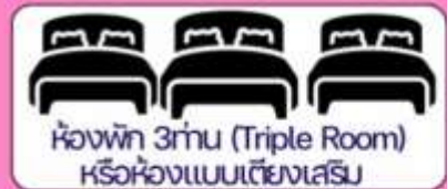
ห้องพัก 3 ท่าน (Triple Room) หรือห้องแบบเตียงเสริม

กรณีพัก 3 ท่านถ้าวันที่เข้าพักโรงแรม ไม่มีห้อง TRP (3 ท่าน) อาจจำเป็นต้องแยกพัก 2 ห้อง (มีค่าใช้จ่ายพักเดี่ยวเพิ่ม) กรณีห้อง TWIN BED (เตียงเดี่ยว 2 เตียง) ซึ่งโรงแรมไม่มีหรือเต็ม ทางบริษัทขอปรับเป็นห้อง DOUBLE BED แทนโดยมีต้องแจ้งให้ทราบล่วงหน้า หรือ หากต้องการห้องพักแบบ DOUBLE BED (1 เตียงใหญ่) ซึ่งโรงแรมไม่มีหรือเต็ม ทางบริษัทขอปรับเป็นห้อง TWIN BED แทนโดยมีต้องแจ้งให้ทราบล่วงหน้า กรณีห้องพักในเมืองที่ระบุไว้ในโปรแกรมมีเทศกาลวันหยุดยาว มีงานประชุมหรืองานแฟร์ต่างๆ บริษัทขอจัดที่พักในเมืองใกล้เคียงแทน