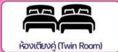
ห้องเตียงคู่ (Twin Room)