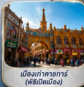
เมืองเก่าคาซการ์ (พิธีเปิดเมือง)