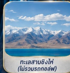
ทะเลสาบซิงไห่ (ไม่รวมรถกอล์ฟ)