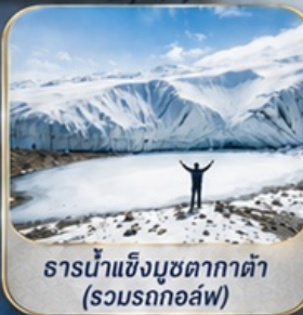
ธารน้ำแข็งมุซตาغاتา (รวมรถกอล์ฟ)