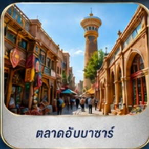
ตลาดอับบาซาร์

**เที่ยวครบทุกวัน...ไม่หลงร้านช้อปปิ้ง**