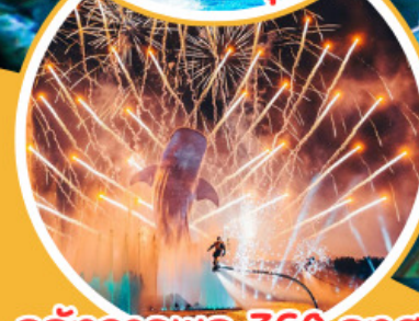
อลังการพลุ 360 องศา

พัก Hengqin Bay 2 คืน!! โรงแรมใกล้สวนสนุก