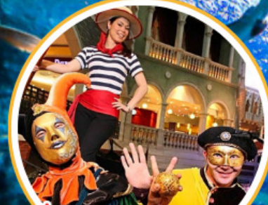
เที่ยวเอเชียแห่งเอเชีย