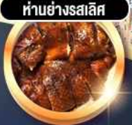
ห่านย่างสลีส