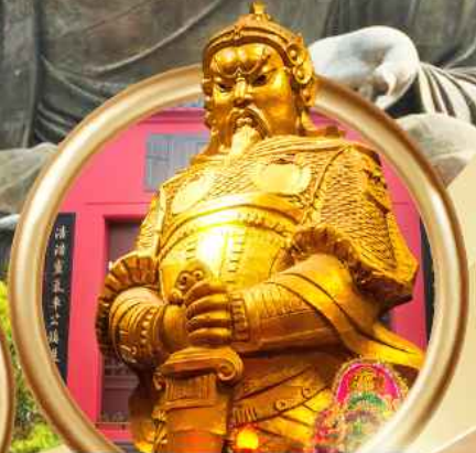
วัดเซกหงหิว