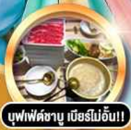
บุฟเฟ่ต์ชาบู เภียรไม่อัน!!