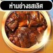
हांอย่างรสเลิศ