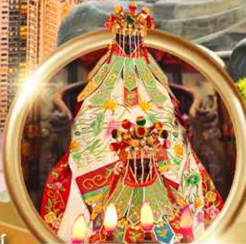
ยืมเงินเจ้าแม่กวนอิมฮ่องกง