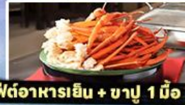
บุฟเฟต์อาหารเย็น + ชาปู 1 มื้อ