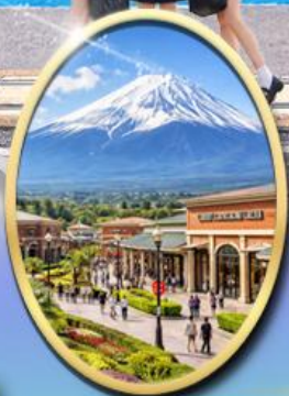
Gotemba Premium Outlets

รหัสทัวร์ RJ-XJ133 เดินทาง 5D 3N กัณยายน 2569