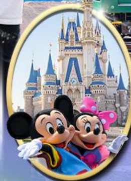
อิสระเลือกซื้อบัตร Tokyo Disneyland

พิเศษ! นั่งรถไฟสาย Enoden Line โอรุโกล์ พิเศษ!