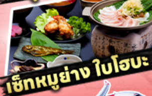
เซ็ทเมนูย่าง ไบโอะ

29,919 ราคาเริ่มต้น บาท รวมภาษีมูลค่าเพิ่ม 7%