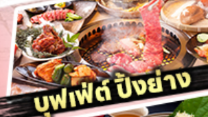
บุฟเฟต์ ปิ้งย่าง