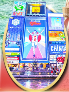
ซ็อบบิง ซินโซบาสึ