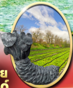
ฟาร์ม วาซาบิ ไดโอะ