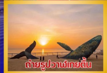
ต่ายรูปวาฬยักษ์ตื่น

สะพานจันเจียว-โบสถ์คาทอลิกชิงเต่า (ชมภายนอก)-ป่าตึกทวน- พิพิธภัณฑ์เบียร์ชิงเต่า -ถนนคนเดินโตตง -ผิงไห่ท้อ-ชายหาดและ จุดต่ายรูปปลาวาฬยักษ์ตื่น -ถนนจ้าวจีป่าเจีย-ชายหาดลากอเวย์ไห่- จัตุรัสชิงฟุเหมิน-สวนเว่ยไห่ -สวนเยวี่ไห่-เกาะหยางหม่าย่าน - เมือง เก่าเหยียนไถ่-ท่าเรือชาวประมงเหยียนไถ่-ภูเขาเหยียนไถ่-จัตุรัส 54 -ศูนย์ โอลิมปิกเรือใบชิงเต่า-ภูเขาเหลาชาน-วัดไท่ซิงกง-สวนเสี่ยวม่วยเต่า ชายหาดทะเลหมายเลข 3-อาคารไห่เทียน ชั้น 81- Cyber Punk