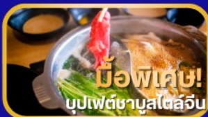
มีอาหารพิเศษ! บุปเฟ่ต์ชาบูสไตล์จีน

เดินทาง : สิงหาคม - ตุลาคม 2569 6 วัน 4 คืน น้ำหนักกระเป๋า 23kg