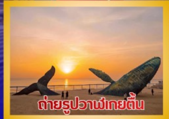
ต่ายรูปวาฬยักษ์ตื่น

สะพานจันเจียว-โบสถ์คาทอลิกชิงเต่า (ชมภายนอก)-ป่าตึกวน- พิพิธภัณฑ์เบียร์ชิงเต่า -ถนนคนเดินโตตง -ผิงไห่เก้อ-ชายหาดและ จุดต่ายรูปปลาวาฬยักษ์ตื่น -ถนนจ้าววีป่าเจีย-ชายหาดสากลวยไห่- จัตุรัสชิงฟุเหมิน-สวนเว่ยไห่ -สวนเยวี่ไห่-เกาะหยางหม่าย่าน - เมือง เก่าเหยียนไถ่-ท่าเรือชาวประมงเหยียนไถ่-ภูเขาเหยียนไถ่-จัตุรัส 54 -ศูนย์ โอลิมปิกเรือใบชิงเต่า-ภูเขาเหลาซาน-วัดไท่ซิงกง-สวนเสี่ยวม่วยเต่า ชายหาดทะเลหมายเลข 3-อาคารไห่เทียน ชั้น 81- Cyber Punk