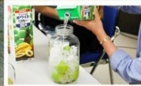
เวิร์กช็อปทำ Umeshu