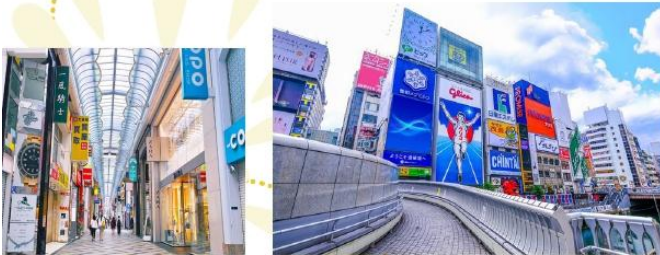
SHOPPING AT SHINSAIBASHI

ช้อปปิ้งจุใจที่ “ชินไซบาชิ” ย่านการค้าสายยาวที่โด่งดังที่สุดในจังหวัดโอซาก้า ละลายกรีพโยกับร้านค้าแบรนด์เนม เครื่องสำอาง สินค้าแฟชั่น และร้านขนมของฝากที่เรียงรายตลอดสองข้างทาง อีสระให้ท่านเดินเล่น ถ่ายรูป และเลือกซื้อของขวัญของฝากได้อย่างเต็มที่