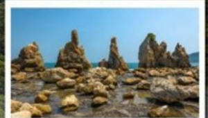
ชายหาดฮาชิคุอิ:

🧳 โหลด 23 KG. x2 ( รวม 46 KG. ) ทั้งไป - กลับ