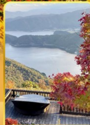
ชมยูมาทากะ