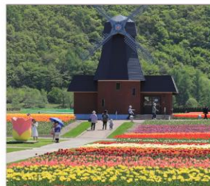
ดามิยูเม็ตสึ(ทิวลิป)