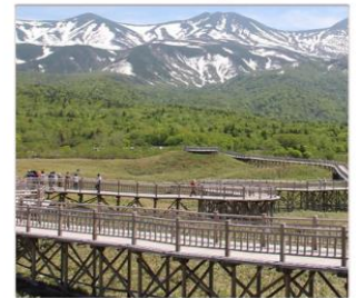
ทะเลสาบทั้ง5ชิเรโตโกะ