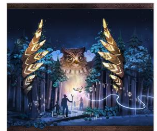
kamui lumina night