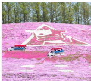
ฮิกาชิโมโกโตะ(พื้งมอส)