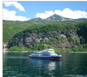
ล่องเรือแฉลมชิเรโตโกะ