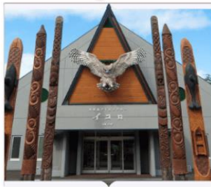
หมู่บ้านไอนุโคตัน