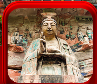
“ ผาหินแกะสลักต้าจู้ ”

บินตรงลงชิง • อุหลง หลุมฟ้าสะพานสวรรค์ • ระเบียงแกว • อุทยานเขานางฟ้า หงหยาดัง • นิ่งรถไฟคะลุดัก • ศาลาประชาม (ด้านนอก) • หลงหมินฮ่าว มรดกโลกผาหินแกะสลักต้าจู้ • วัดหลิวฮั่น • ตึกตะเกียบ • หมู่บ้านโบราณสี่ซีโหว่