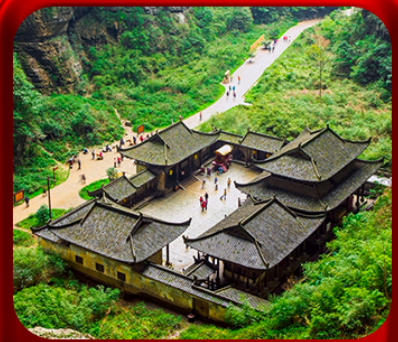
“ อุทยานหลุมฟ้าสะพานสวรรค์ ”