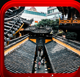
“ วัดหลิวฮั่น ”