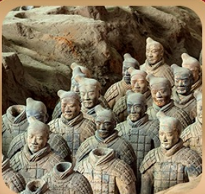
“สุสานจีนซีฮ่องเต้”