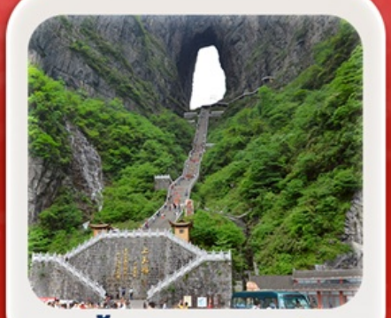
“กำประตูลิ่วหวง”