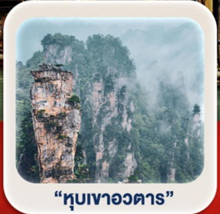
“หุบเขาอวตาร”