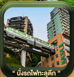
“ นั้รทไฟทะลุดัก ”

中国南方航空 CHINA SOUTHERN สายการบิน China Southern Airlines (CZ)