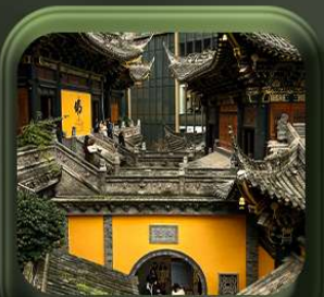
“ วัตหลว้อัน ”