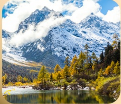
“ปี้ฝิงโกว”

ชมธรรมชาติ 2 อุทยานขึ้นชื่อ อุทยานภูเขาสีดรุณี + อุทยานปี้ฝิงโกว สะพานหนานเฉียว • ถนนคนเดินไท่กู่หลี่ + ซุนซีลู่ + Pop Mart • ดงเจียวจี้