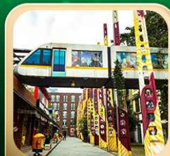
“ตงเจียวจี้”