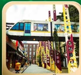
“ดงเจียวจี้”