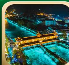
“สะพานหนานเฉียว น้ำตาสีฟ้า”