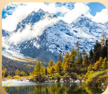
“ป่าผิงโกว”

ชมธรรมชาติ 2 อุทยานขึ้นชื่อ อุทยานภูเขาสี่ดรุณี + อุทยานป่าผิงโกว สะพานหนานเฉียว • ถนนคนเดินไท่กู่หลี่ + ชุนซีลู่ + Pop Mart • ตงเจียวจี้