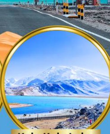
Kala Kule Lake