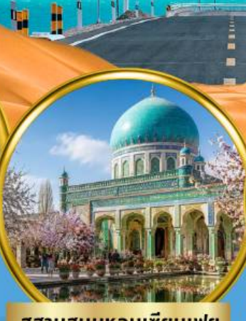
สุสานสนมหอมเทียนเฟย