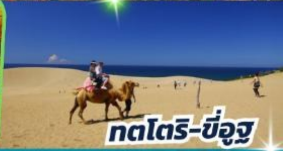
ทตโตริ-ซ็องสุ