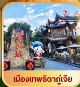
เมืองเทพริดาตุ๋เจีย