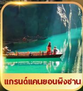
แกรนด์แคนยอนผิงซาน