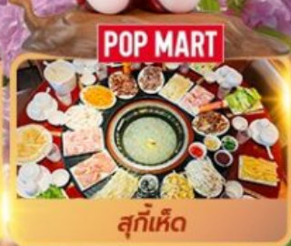
POP MART สุกี้เห็ด