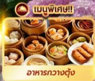
เมนูพิเศษ!! อาหารกวางตุ้ง