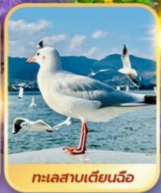
ทะเลสาบเตียนฉือ