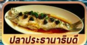
ปลาประจานาธิบดี